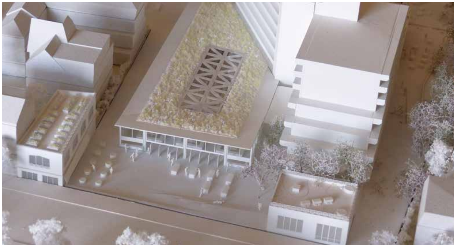
La maquette du projet du futur marché.