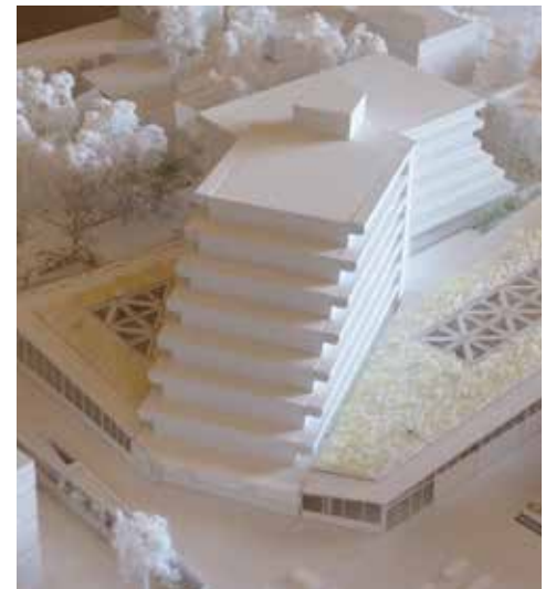
Le marché depuis la rue des Avelines.

une halle lumineuse, qui évoque les structures industrielles des ingénieurs du début du XX e siècle. Une trame structurelle composée de poteaux surmontés d'une arborescence en béton clair supportera une toiture végétalisée. Des ouvertures zénithales seront possibles au centre du marché. Des portes pivotantes en bois permettront de larges ouvertures. Nous travaillons également avec le paysagiste Champ Libre pour aménager les espaces extérieurs ainsi que la toiture végétalisée qui permet de limiter l'effet d'îlot de chaleur et d'avoir un rôle de rétention d'eau. ■