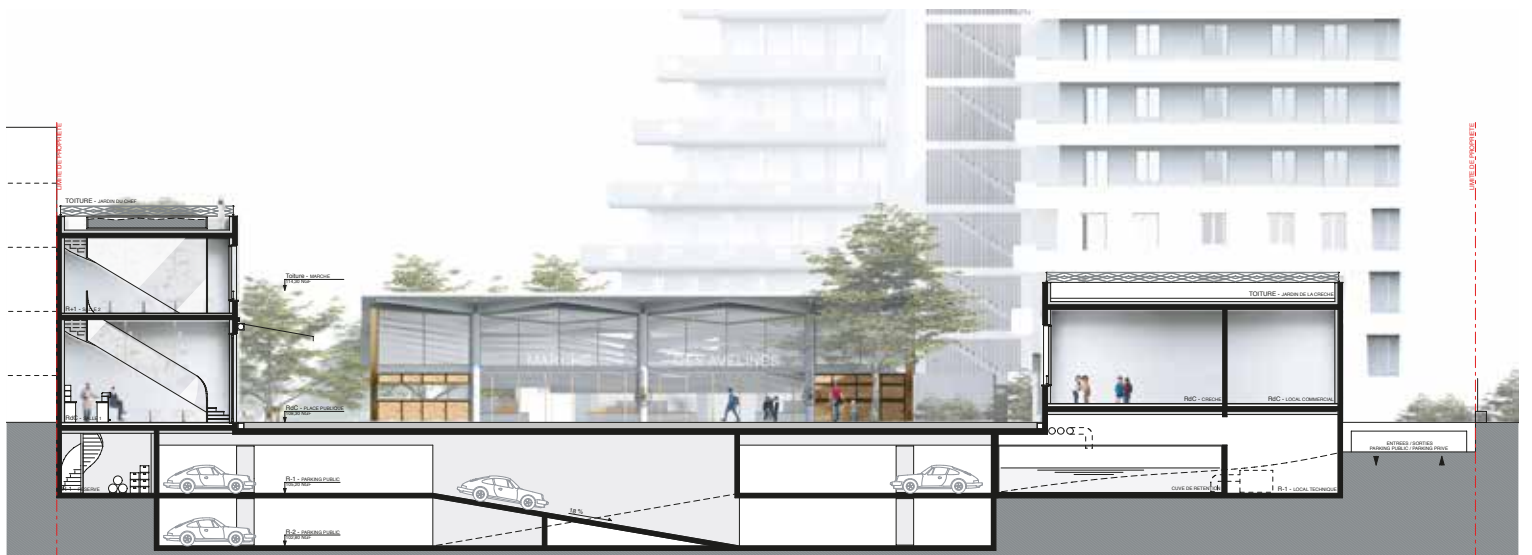
Le futur parking du marché.