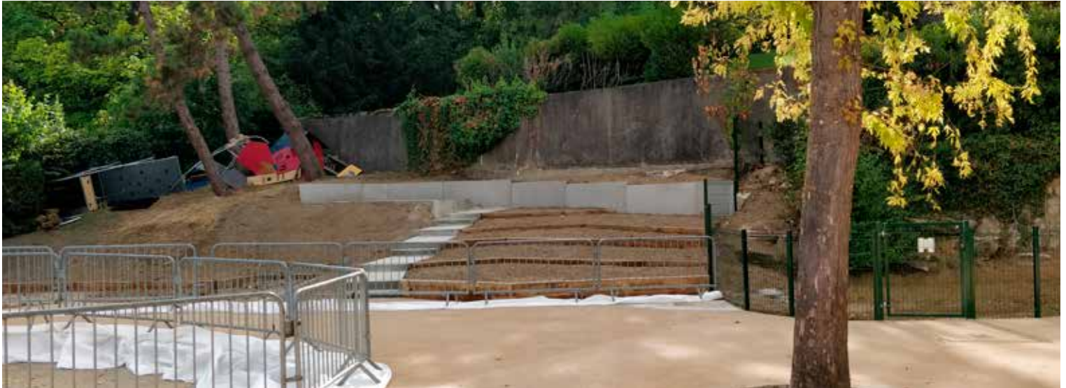
Aménagement de la cour de l'école maternelle du Centre.