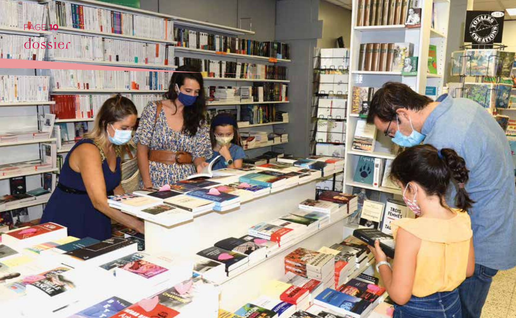
À la librairie Les Cyclades.