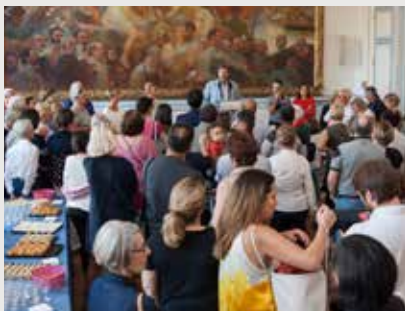
Cocktail de bienvenue organisé à l'hôtel de ville en octobre 2018.

Permanences les mardis et jeudis de 14 h 30 à 17 h et les samedis de 10 h à 12 h.