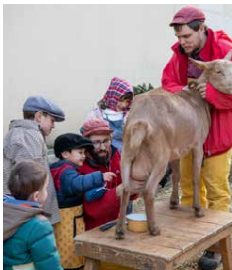
Animation Noël au marché en décembre 2019.

digital municipal au service des commerçants et des Clodoaldiens et enfin développer les services de livraison à domicile. Alimentaire, services, restauration, supermarchés, prêt-à-porter/décoration... les commerces foisonnent à Saint-Cloud et c'est tant mieux ! De nombreuses nouvelles activités ont vu le jour ces dernières années. La volonté de maintenir une dynamique commerciale durable est une priorité. En tout, près de 300 commerces se partagent l'espace clodoaldien ! » conclut l'élue au Commerce.