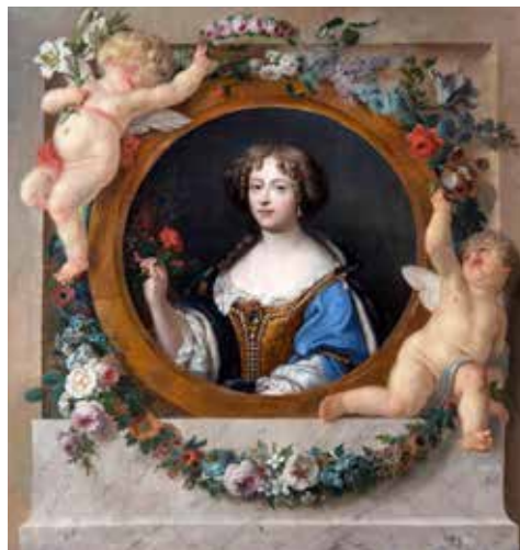
Portrait de la princesse Palatine par Jean-Pierre Franque (1774-1860) Huile sur toile, 1838-1840 Saint-Cloud, musée des Avelines, dépôt du musée Bertrand de Châteauroux, inv. 2012.2.3 (...)

Le portrait est un dessus-de-porte, commande du roi Louis-Philippe qui souhaitait placer en vis-à-vis les portraits des deux épouses successives de Philippe d'Orléans, Henriette d'Angleterre et la princesse Palatine, dans la Chambre rouge de l'aile de l'orangerie. Le peintre Jean-Pierre Franque, ancien élève puis assistant de Jacques-Louis David, après avoir signé des scènes bibliques et mythologiques néo-