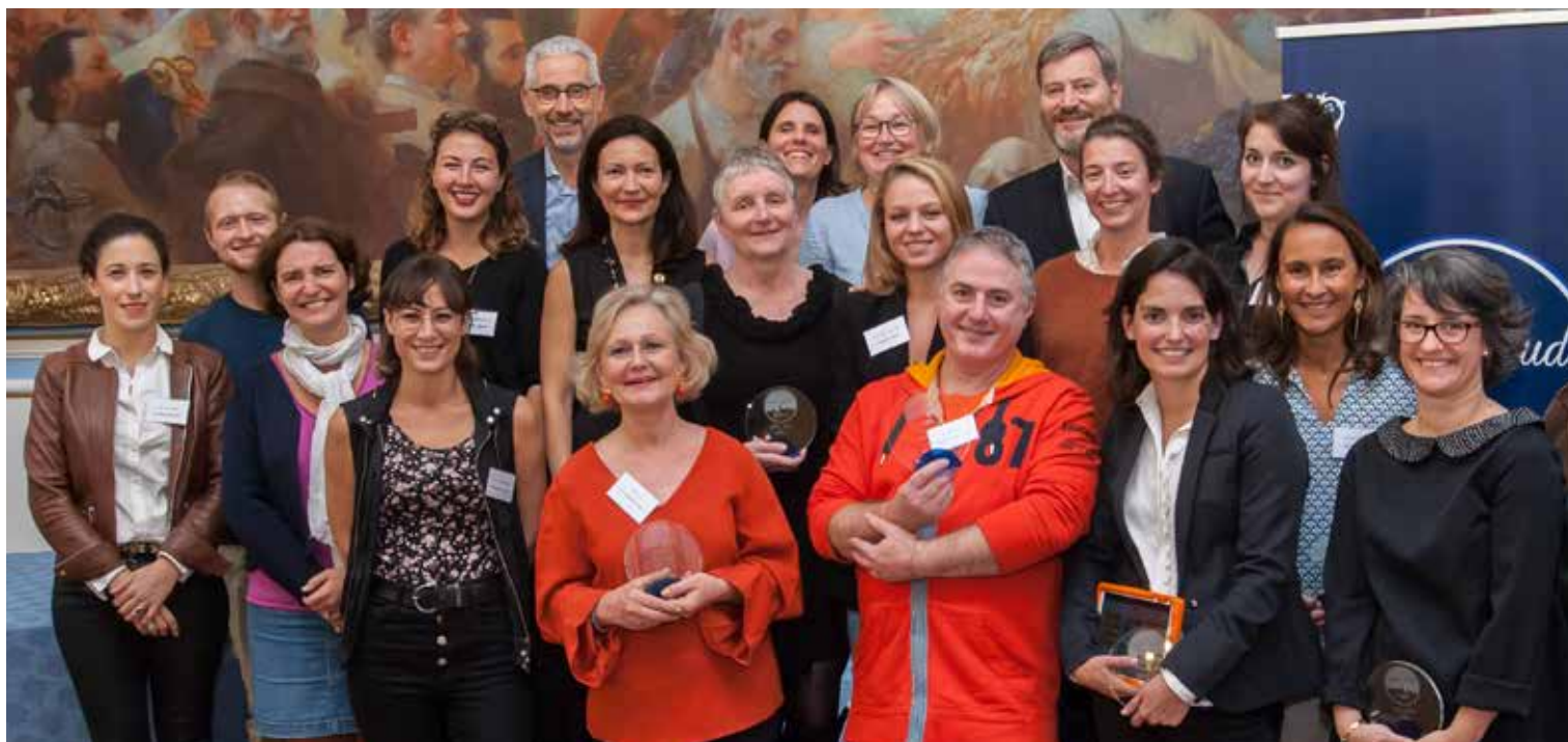
Les labellisés 2019 lors de la remise des prix en octobre 2019.

Pour faire connaître et valoriser les commerçants, créateurs, artisans ou entreprises qui créent et innovent à Saint-Cloud, la Ville a créé l'an dernier le Label Saint-Cloud. Seize artisans-créateurs et entrepreneurs clodoaldiens ont obtenu cette distinction en 2019. Compte tenu du contexte actuel, la sélection initialement prévue en avril a dû être reportée. Les prochains lauréats seront primés en 2021.