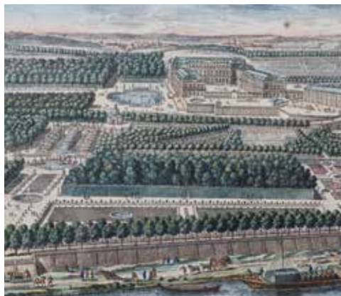
Vue générale du château de Saint-Cloud Attribuée à Adam Pérelle (1640-1695) Gravure en creux rehaussée de gouache, 1680 Saint-Cloud, musée des Avelines, inv. G 988.1.11 a (...).

Le samedi 17 octobre à 16h30 , plongez dans les fastes du Grand Siècle avec la conférence Le Château de Saint-Cloud au temps de la Palatine . Apogée du classicisme et de l'Ancien Régime, le XVII e siècle est marqué par un foisonnement culturel et architectural majeur. Si on parle beaucoup de Versailles, les châteaux alentours ne sont pas en reste, et celui de Saint-Cloud ne fait pas exception à la règle : devenu propriété de Philippe d'Orléans, il est agrandi et embelli par les architectes