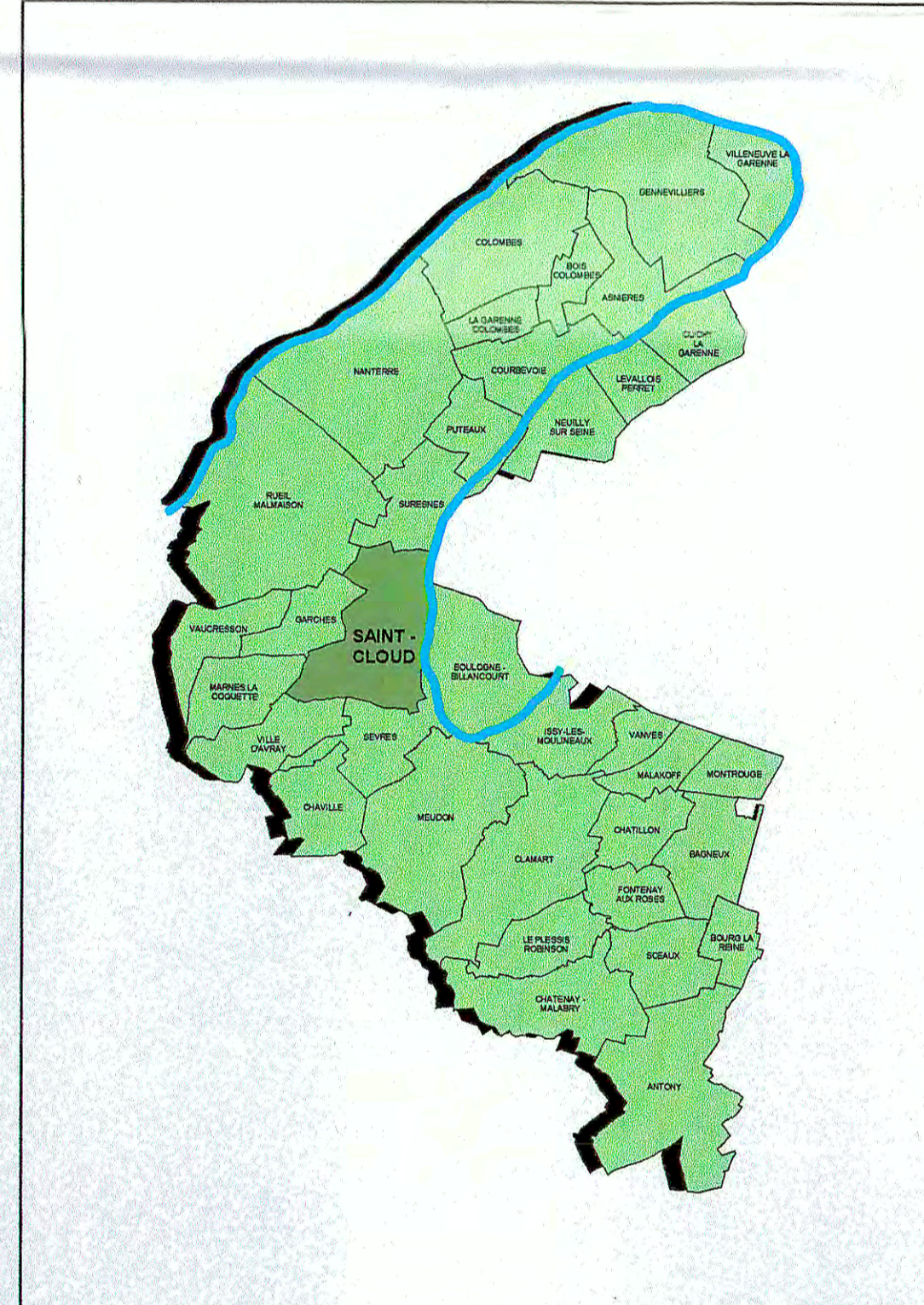
Planche Sud (1/2500ème)