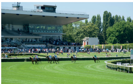
Vue du Grand Prix de Saint-Cloud.

En 1918, la Société d'encouragement pour l'amélioration du cheval français de demi-sang cède le bail à la Société sportive d'encouragement, qui exploite les hippodromes de Maisons-Laffitte et d'Enghien, où a lieu le prix du Président de la République. Ce dernier est ainsi transféré à Saint-Cloud. L'ensemble du domaine devient ensuite la propriété de la Société immobilière de la Fouilleuse, qui transforme l'hippodrome en 1955. La modernisation est confiée à Eugène Lizerio (1907-1987) qui reconstruit notamment les tribunes, guichets, stalles et boxes. L'hippodrome de Saint-Cloud, constitué d'une piste de 2 300 mètres en herbe, fait aujourd'hui partie du patrimoine de France Galop qui y programme une trentaine de courses par an, ainsi que le Grand Prix de Saint-Cloud. En 2023, l'hippodrome de Saint-Cloud a obtenu le label environnemental et bien-être animal de la filière équine EquuRES. ●