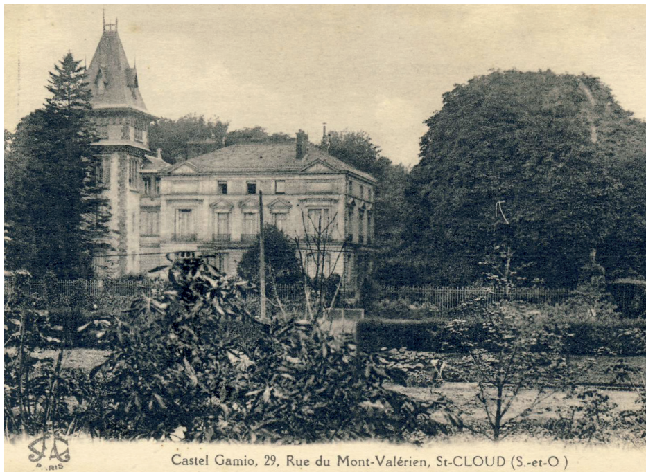
Castel Gamio, 29, Rue du Mont-Valérien, St-CLOUD (S.-et-O)

Castel Gamio, 29, rue du Mont-Valérien, St-Cloud (S.-et-O), avant 1914, carte postale, Saint-Cloud, musée des Avelines