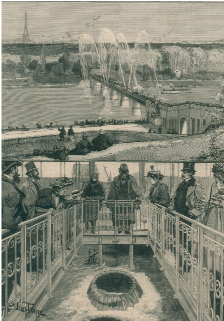
Louis Tinayre (dessinateur), Paris. Inauguration des eaux de l'Avre. La passerelle sur la Seine. Les eaux jaillissant à la bache d'arrivée, dans Le Monde illustré du 8 avril 1893, imprimé, Saint-Cloud, musée des Avelines.

Commencez cette flânerie urbaine en vous rendant au 59, rue de l'Avre.