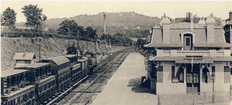
Les Côteaux de Saint-Cloud – Vue intérieure de la nouvelle gare du Val d'or – Le Fort du Mont-Valérien, vers 1911, carte postale, Saint-Cloud, musée des Avelines.

Revenez légèrement sur vos pas pour emprunter la rue du Pierrier jusqu'à la passerelle de la gare du Val d'or.