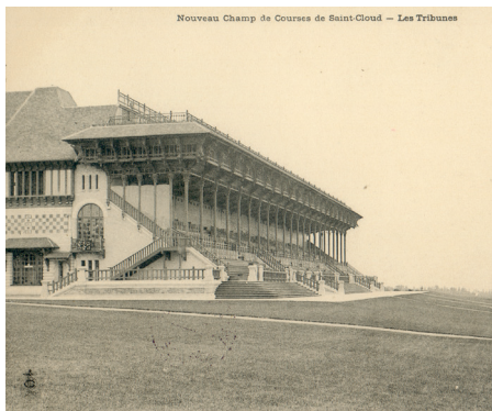
Nouveau Champ de Courses de Saint-Cloud – Les Tribunes, vers 1901, carte postale, Saint-Cloud, musée des Avelines.

Site classé par décret du 8 juillet 1998.