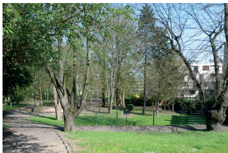
Portrait de Marie Bonaparte, XX e siècle, photographie dédiée par Marie Bonaparte, Saint-Cloud, musée des Avelines.

Pour terminer cette flânerie, revenez sur vos pas et prenez en face la rue Traversière qui vous mènera au parc Marie-Bonaparte.