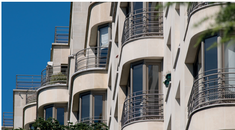
Vue de l'immeuble construit par Louis Faure-Dujarric en 1936 à Saint-Cloud.

Continuez la rue du Mont-Valérien jusqu'au carrefour. Depuis le pont des 3 Pierrots, vous voyez l'immeuble Dujarric.