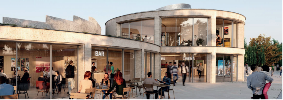
Vue du projet de restructuration du cinéma-théâtre Les 3 Pierrots de Saint-Cloud.

Reprenez la rue du Mont-Valérien, en passant devant l'entrée du jardin des Tourneroches, et rendez-vous au n° 6.