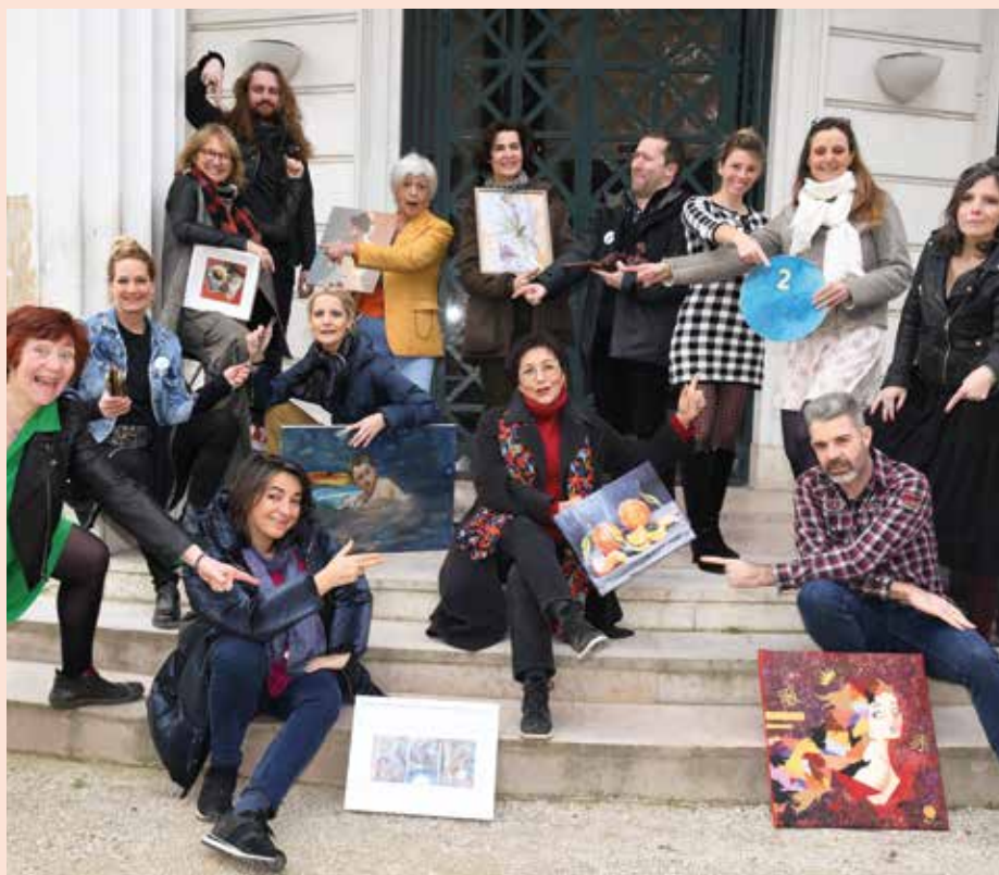
ART en VUE, l'union fait la force!

Créée à Saint-Cloud il y a bientôt trois ans, l'association ART en VUE regroupe aujourd'hui une vingtaine d'artistes de Saint-Cloud et des Hauts-de-Seine, peintres, photographes, sculpteurs, mais également d'autres passionnés, notamment d'art culinaire ou d'architecture.