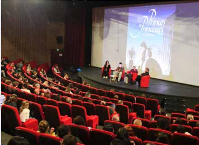
Dernière séance NEON en présence du réalisateur Michel Ocelot.