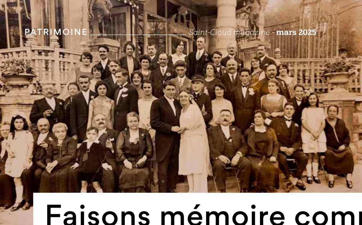
Photographie de mariage devant le Pavillon bleu à Saint-Cloud, 1926