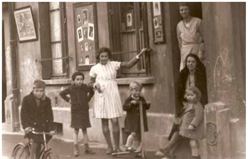
L'atelier du photographe Ernst Steinegger, années 1930

cheur, par exemple en micro histoire, ce courant de recherche qui étudie l'individu, ou une communauté restreinte, dans son environnement et son époque.