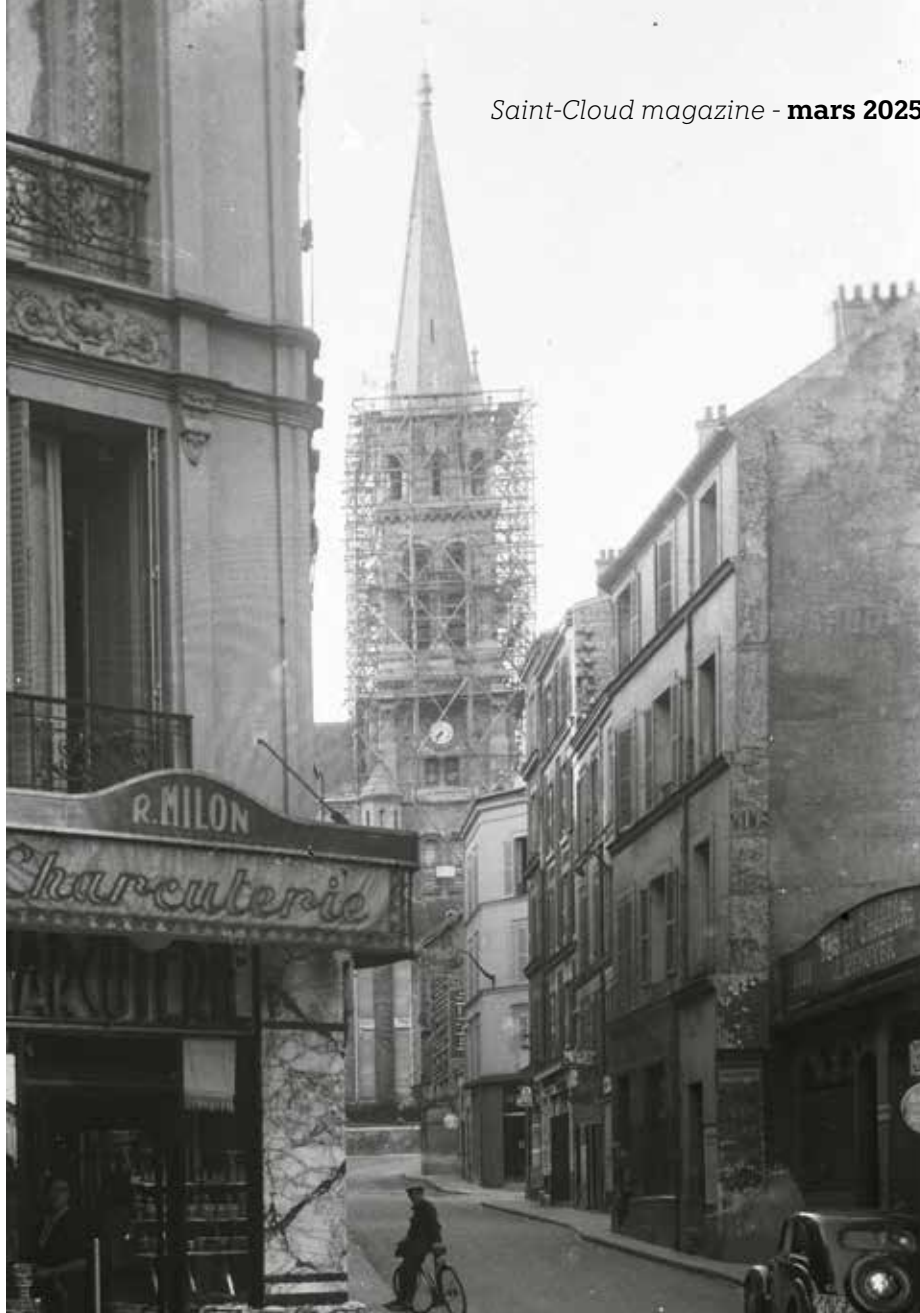
Ernst Steinegger, Vue de l'église Saint-Clodoald en travaux, depuis la rue de l'Église, à Saint-Cloud, 1939 © Saint-Cloud, service Patrimoine et Archives (don de Madame Catherine Steinegger).

Les documents versés aux archives restent imprescriptibles – ils ne peuvent perdre leur caractère public – et donc inaliénables – ils ne peuvent être vendus ni cédés d'aucune façon par la Ville. Toute personne peut venir les consulter, selon les règles de communicabilité en vigueur. Vos archives viendront enrichir la connaissance de l'histoire locale, et pourront être valorisées dans le cadre d'expositions, de travaux de recherche ou d'actions pédagogiques.