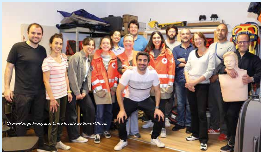
Croix-Rouge Française Unité locale de Saint-Cloud.