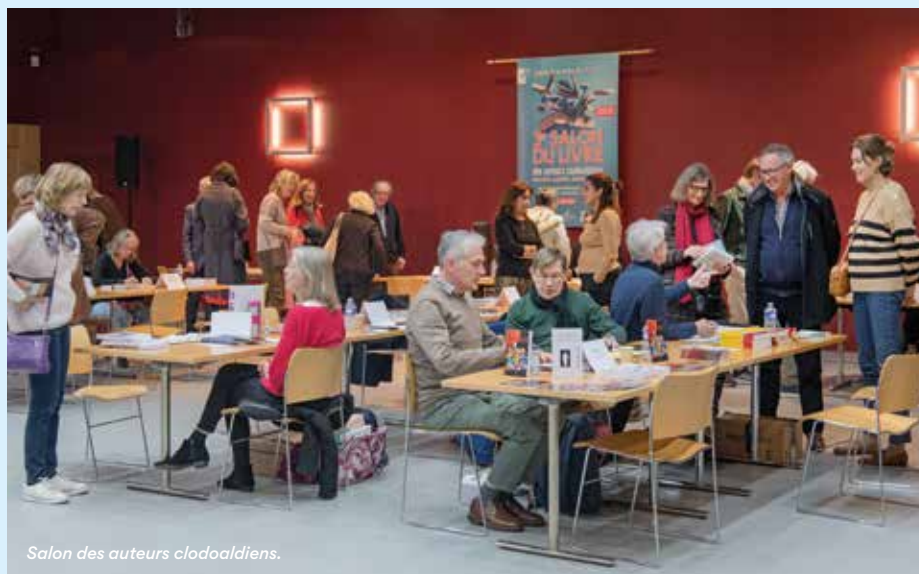
Salon des auteurs clodoaldiens.

Renseignements au 01 47 71 08 74, à accueil@conservatoiresaintcloud.com ou sur conservatoiresaintcloud.com 30 ter, boulevard de la République.