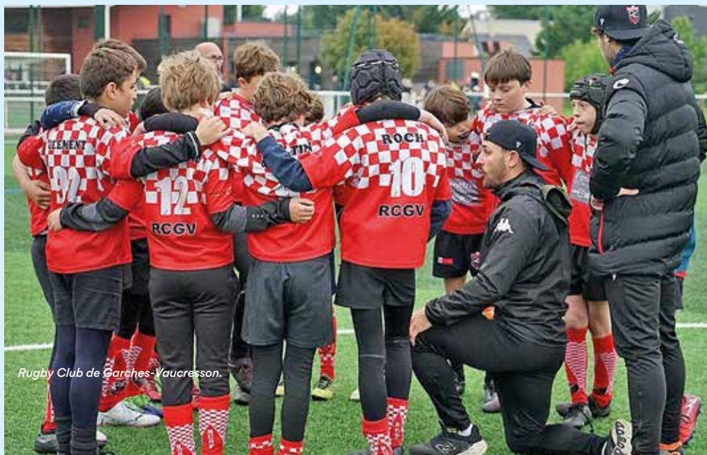
Rugby Club de Garches-Vaucresson.