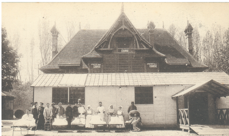
Hôpital Militaire Canadien - Saint-Cloud - Salle de Chirurgie, 1916-1919, carte postale, Saint-Cloud, musée des Avelines.